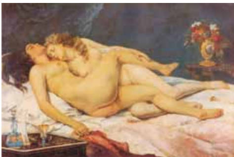
El sueño (1866) Gustavo Courbet Museo du Petit Palais, París

Pero también el amor es el lugar donde las palabras sobran. Ya planteamos que para los seres humanos lo no-dicho es comunicación, y por tanto sujeto de interpretación. Pero, además, para los amantes el silencio tiene dos connotaciones muy especiales: cuando remite a presencia es colmamiento; cuando remite a ausencia es desesperación. Cuando remite a colmamiento es éxtasis y se prolonga en el tiempo; cuando es desesperación remite a vacuidad y debe ser “llenado” con gestos o palabras para minimizar la desolación y la angustia. Cuando en el silencio existo, soy un “dios”; cuando no existo, soy un “fantasma” (21).