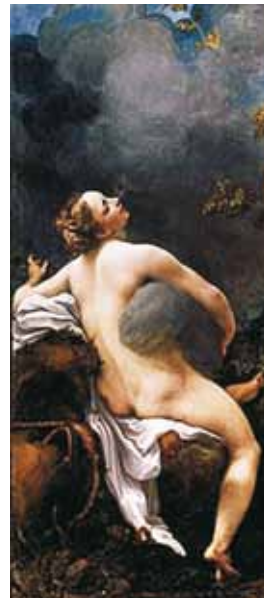
Júpiter e Io (1532) Antonio Correggio Museo de Ciencias Naturales, Viena

2. Es interés generalizado que el deseo erótico se ancle a un sólo ser. No obstante, esto es bastante difícil de satisfacer, porque su condición sine quanon es su peregrinar constante. De hecho se desea a muchos o muchas, y se ama a muy pocos o pocas. Paz así lo expresa: “Nada más real que este cuerpo que imagino; nada menos real que este cuerpo que toco y se desmorona en un montón de sal o desvanece en una columna de humo. Con ese humo mi deseo inventará otro cuerpo...” (16). Equiparar amor con deseo es un grave error. El amor es algo más serio y profundo, en el cual, mediante una elección libre, ato mi deseo a ti como expresión del sentimiento que te profeso.