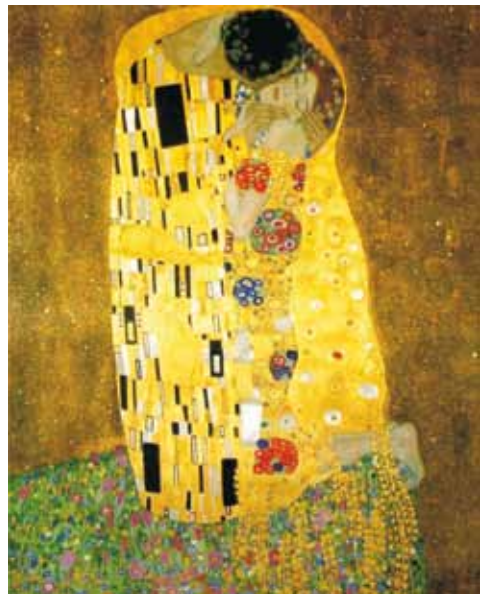
El beso (1908) Gustav Klimt Museo Galería Österreichische, Viena

Para ser caricia, el tipo de lenguaje elegido debe estar impregnado de deseo, alegría y compasión. Entre quienes se aman estos elementos se entrelazan, se ocultan o se disfrazan para expresar, según las circunstancias seducción, complicidad y confianza.