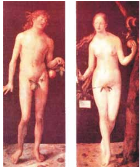
Adán y Eva (1507) Alberto Durero Museo del Prado, Madrid

Así lo expresa Martín Buber: “En la sociedad humana, en todos sus niveles, las personas se confirman unas a otras de modo práctico, en menor o mayor medida, en sus cualidades y capacidades... El deseo de todos es ser confirmados por otros como lo que creemos que somos, e incluso como lo que podemos llegar a ser... La humanidad real sólo existe cuando esta capacidad se desarrolla”.