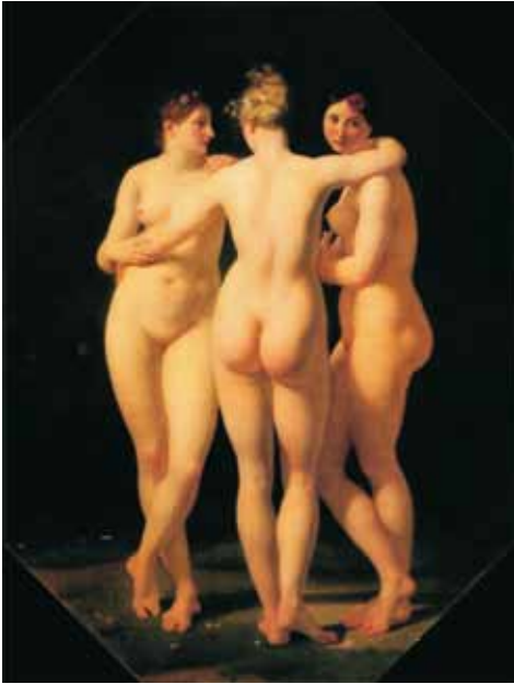
Tres Gracias (1793) Jean Baptiste Regnault Museo de Louvre, París

de interacción, recurriendo a expresiones de poder, engaño o maltrato.