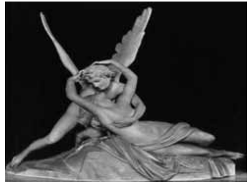
Eros y Psique (1793) Antonio Canova Museo de Louvre, París

Cuando hacemos mención a la comunicación humana nos referimos a un sistema de signos y de símbolos que abarcan no sólo el lenguaje hablado o escrito, sino también todo lo relacionado con la actitud, el gesto, la pintura, la escultura, la fotografía, la música, la escenografía y demás.