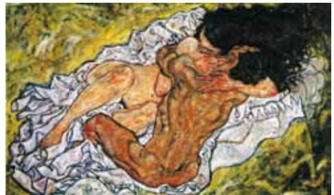
Abrazo (1917) Egon Schiele Ubicación incierta

Comunicarnos acerca de cómo nos relacionamos es imprescindible. Es imposible que no dialoguemos sobre el tipo de vínculos que tenemos: cómo nos percibimos, cómo actuamos, cómo nos relacionamos, cómo quisiéramos ser. Este proceso hace indispensable traducir satisfactoriamente el modo actitudinal al modo verbal. Desde ya podemos imaginar las enormes dificultades que se pueden presentar en el intento de hacer coincidir los aspectos informáticos y los relacionales.