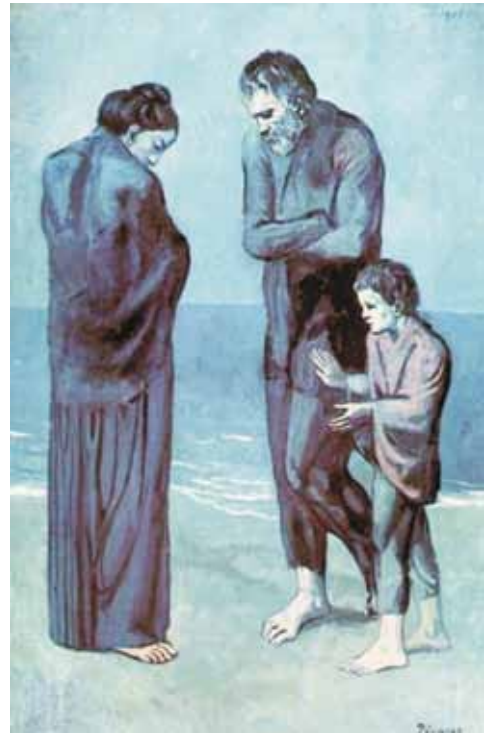
La tragedia (1903) Pablo Picasso Galería Nacional de Arte, Washington, DC.

Un hombre con los brazos cruzados y las manos escondidas, una mujer de medio perfil, un niño que los acompaña; los adultos con la cabeza gacha y la espalda encorvada; todos vestidos con harapos y descalzos. En ellos es evidente su miseria y su desvalimiento. Cuanta tristeza y cuanta desolación. Sólo el niño manifiesta un leve signo de esperanza. Es como si Dios los hubiese abandonado a su suerte y la vida no tuviese sentido alguno. Este cuadro, sin que medie palabra alguna, expresa la tragedia humana.